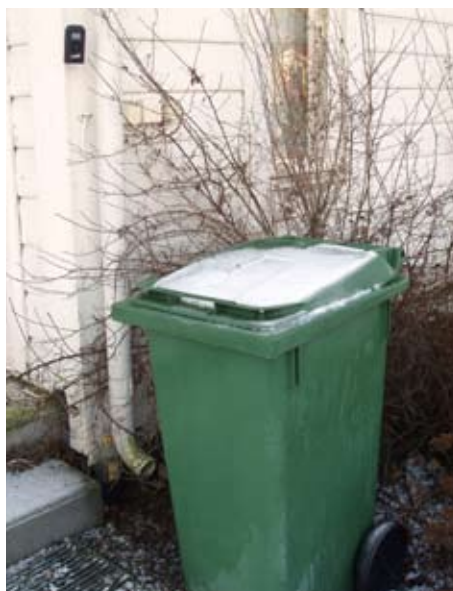
"Critter Gitter" monteras så att djurets rörelser kan registreras och aktivera ljudskrämmen (högst upp till vänster i bilden).