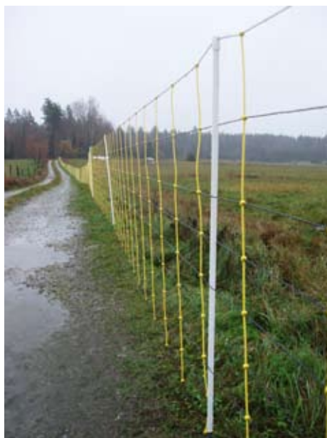
Ett elnät med styva vertikala ledare kan monteras som en akutåtgärd.

Bedriver man biodling i ett område med regelbunden förekomst av björn och råkar ut för skador bör man genast vidta åtgärder för att förhindra flera skador. Risken är stor för att björnen hittar även resterande bikupor i området.