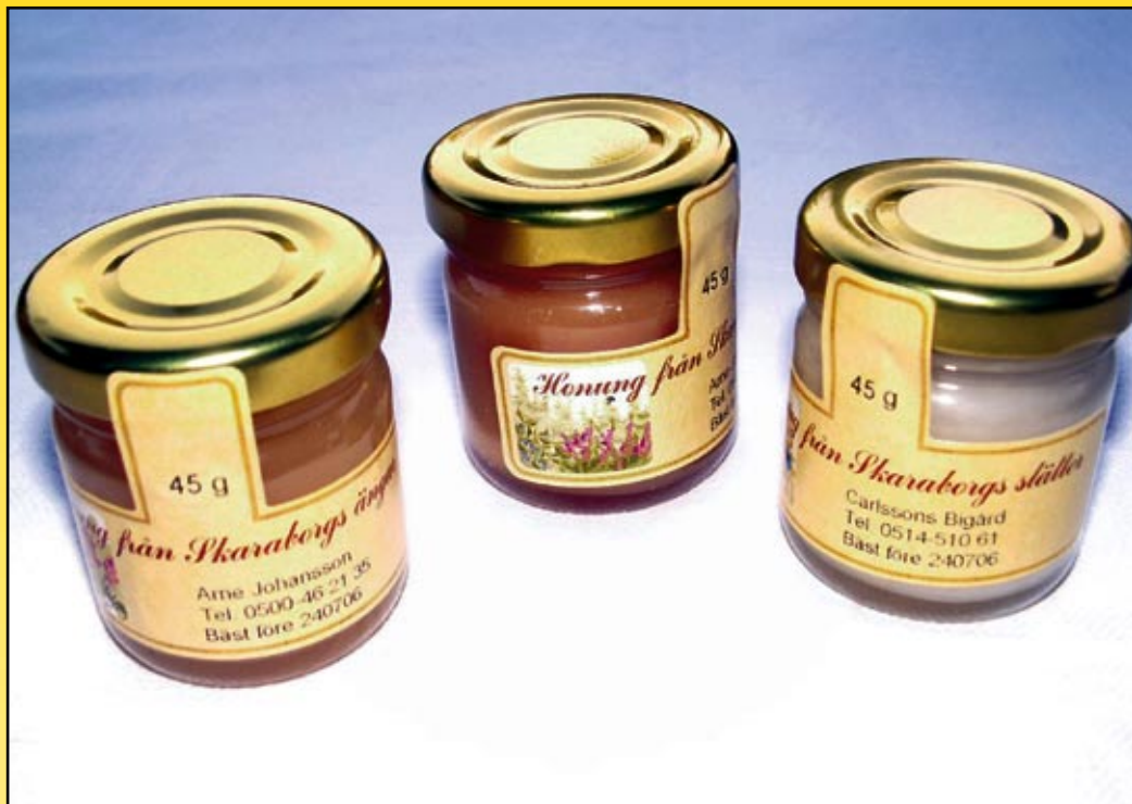
Genom att flera biodlare samarbetar går det lättare att få fram honung med olika karaktär.

Sen handlar det om att ta hand om honungen på bästa sätt. Honungen från