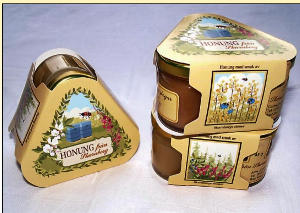
En tilltalande förpackning är viktig om vi vill ta oss in på marknaden för souvenirer och presenter.

Att direktappa honungen på konsumentförpackning är det bästa, honungen blir fast, det vill säga lagringsduglig och den utsätts inte för onödig värme. En nackdel kan vara det rimfrostmönster som ibland kan uppstå på glasets insida, trots alla förklarar-