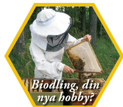
Biodling, din nya hobby?

Sommaren: Bisamhället växer snabbt och biodlaren utökar bikupan så att alla får plats, annars svärmar bina. Ungefär vid mid-sommar kan man skatta den första honungen. I början av augusti börjar blomningen ta slut och det är oftast dags att invintra bina.