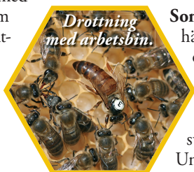
Drottning med arbetsbin.

Hösten: Bisamhället känner att det är ont om mat i naturen, vintern närmar sig. Drönarna har motats ut ur kupan. Drottningen övervintrar bara tillsammans med arbetsbina. Biodlaren förbereder bina genom att ersätta honung med sockervatten som bina lägger i matförrådet. Detta äter bina under hela vintern för få energi och hålla värmen.