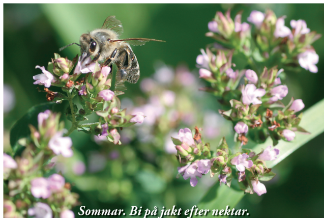
Sommar. Bi på jakt efter nektar.