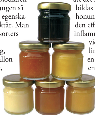
All honung är unik.

I honungen finns också beståndsdelar som har probiotisk effekt.