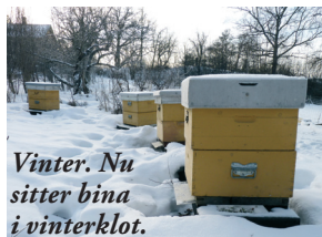
Vinter. Nu sitter bina i vinterklot.