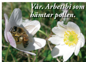
Vår. Arbetsbi som hämtar pollen.