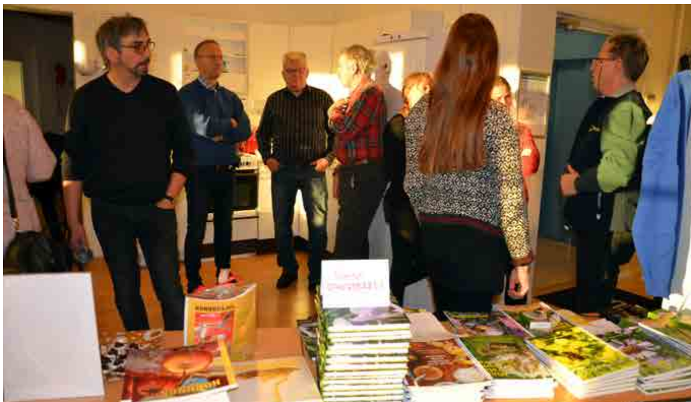
I Luleå blev det samling kring bokbordet i pauserna.