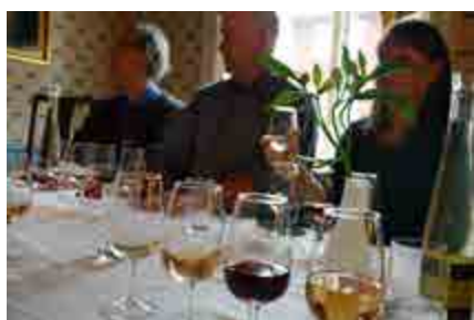
Mjöd har tillverkats och druckits i många forntida kulturer och ofta kallats gudarnas dryck.