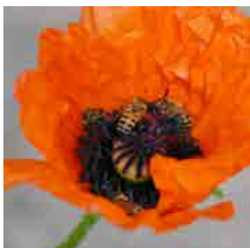
Bin i vallmo.

Pricken över i:et på omslaget påminner om att drottningen märks gul i år.