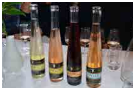
De fyra årstiderna på flaska.