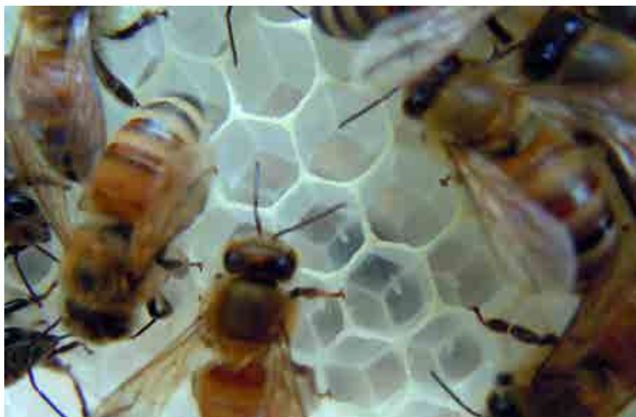
Det är brist på vax.

I tidningen "Deutsches Bienen Journal" beskriver en biodlare sina problem med vaxet under den gångna säsongen och han rapporterar även att han haft kontakt med ytterligare biodlare som haft motsvarande problem och flera har fått sitt vax från samma leverantör. Man har i Tyskland till exempel observerat att bina ogärna vill bygga ut dessa kakor, att yng-