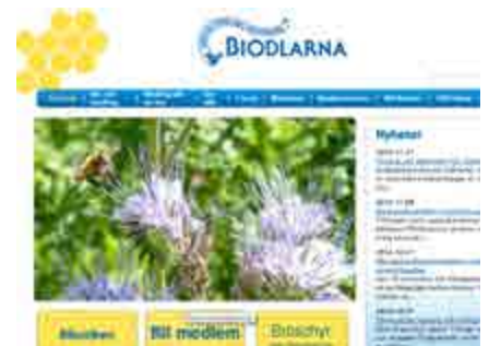
Hemsidan blir mer användarvänlig.