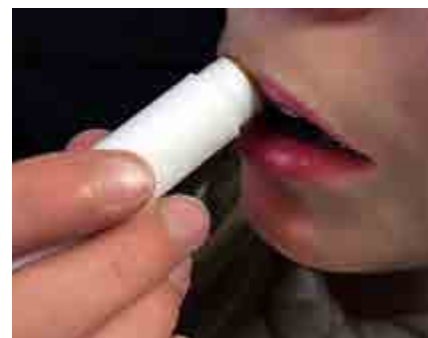
Biodlarna vill att regelverket kring småskalig produktion av salva ses över.

Svar: Jodå, vi vill fortsatt följa reglerna om korrekt innehållsförteckning, hygienreglerna och möjligheten att spåra innehåll. Producentansvaret ska finnas kvar. Biodlare brukar vilja använda så rena och