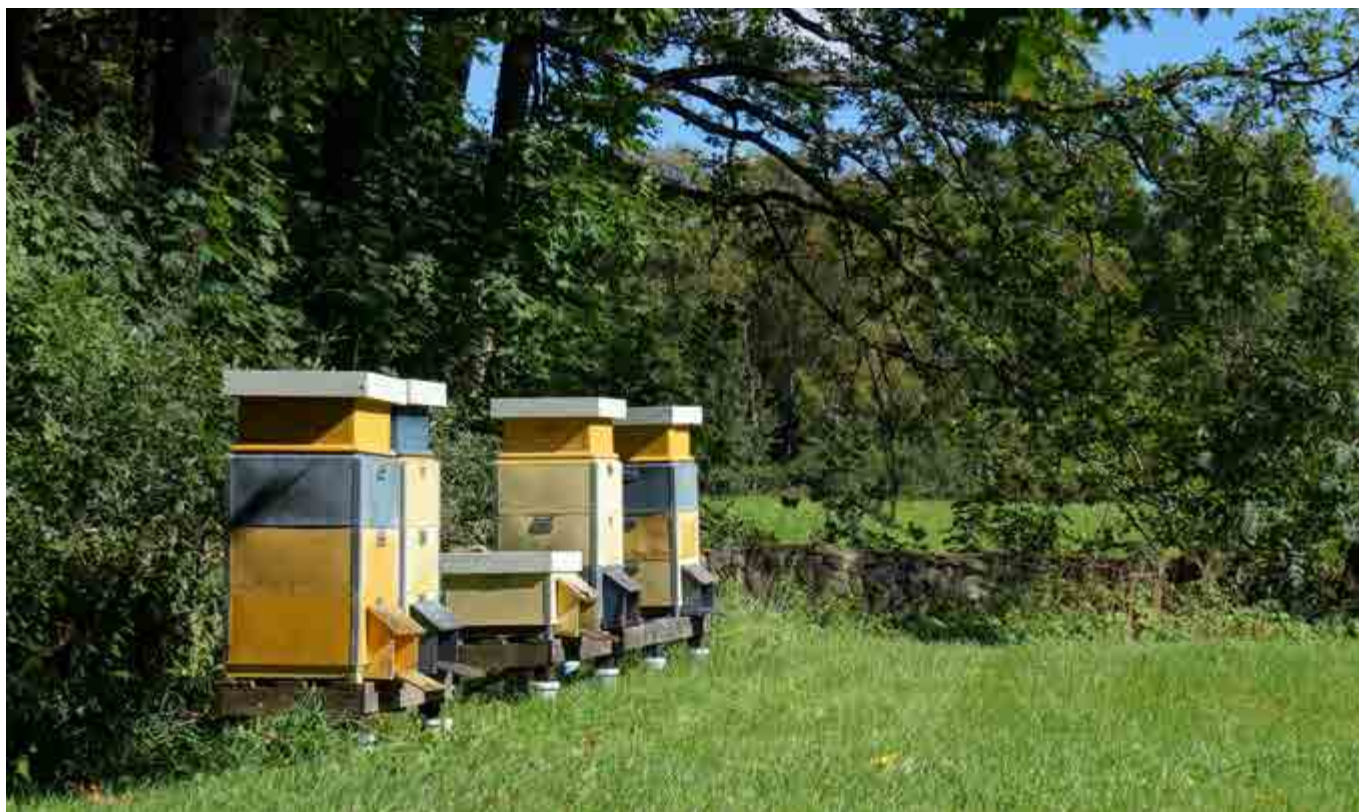
Av praktiska skäl omfattar en bigård en uppställningsplats där flera samhällen placeras nära intill varandra.