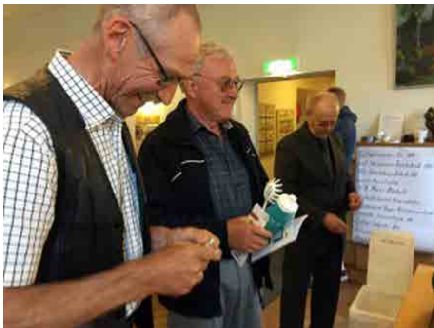
Tre duktiga biodlare i Kronoberg.

100-årsjubileet firades den 18 juni 2016 i IOGT/NTO:s lokaler i Växjö. Programmet för dagen var upplagt på un-