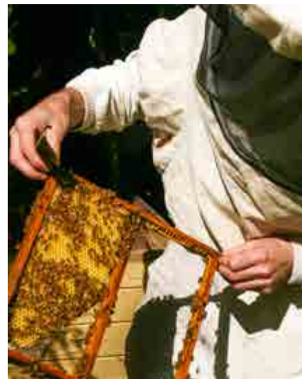
Bitillsynspersonen ska informera om olika metoder att bekämpa varroakvalster, till exempel utskärning av drönaryngel.

Att klargöra hur allvarligt läget egentligen är på bisjukdomsfronten är inte alltid alldeles lätt, förklarar Gunilla Streijffert vid länsstyrelsen i Dalarna. Även hon framhåller anmälan av uppställningsplatser som ett exempel som många biodlare väljer att ignorera.