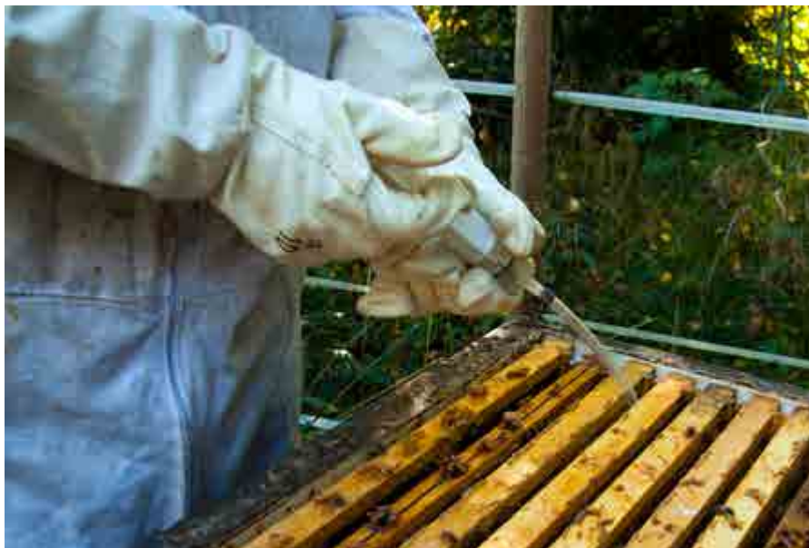
Behandling av varroadrabbade samhällen är viktigt att genomföra.

Bitillsynsmannen arbetar på länsstyrelsens uppdrag, men rekryteras av förståeliga skäl oftast inom någon biodlareförning – och uppfattas många gånger felaktigt som föreningens funktionär. Lagtexten säger att ”till tillsynsman skall utses en i biskötsel kunnig person som har erforderlig kunskap om smittsamma bisjukdomar och