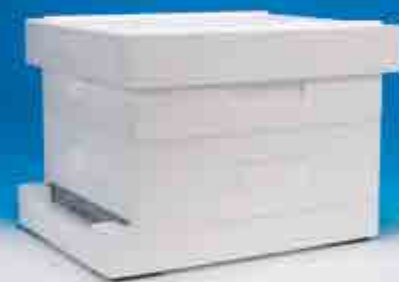
3/4 Langstroth, 120 gr / Liter Finns även med slimmat tak