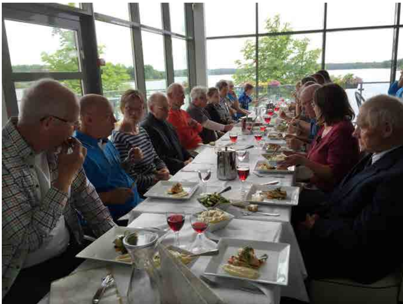
Dagen avslutades med en middag.