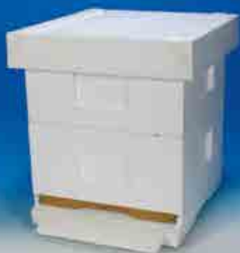
Lågnormal / HLS, 120 gr / Liter

Besök oss gärna på Biodlarkonferensen i Nyköping, 10-12 febr 2017