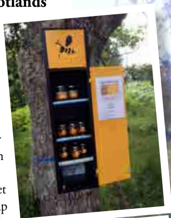
Jörgen Nords kunder betalar kontant eller swishar pengar.

– Fler borde satsa på sådana här skåp som komplement till skyltar med ”honung säljes”.