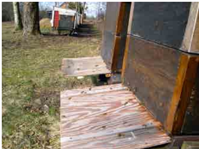
Landningsbana sparar bin.