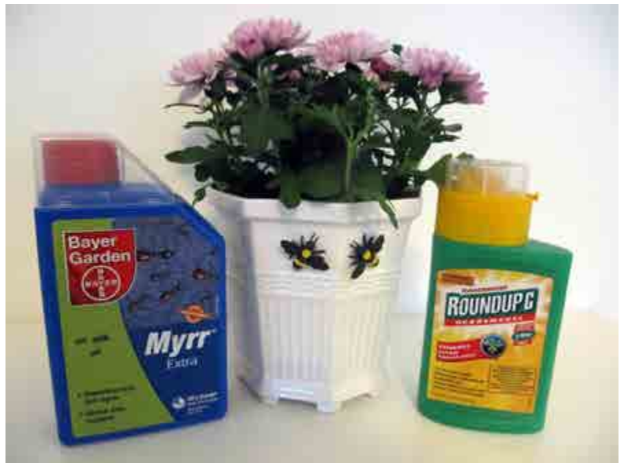
Trycket på att skydda pollinatörer ökar. Bland annat kräver biodlare tydligare märkning på pesticider.