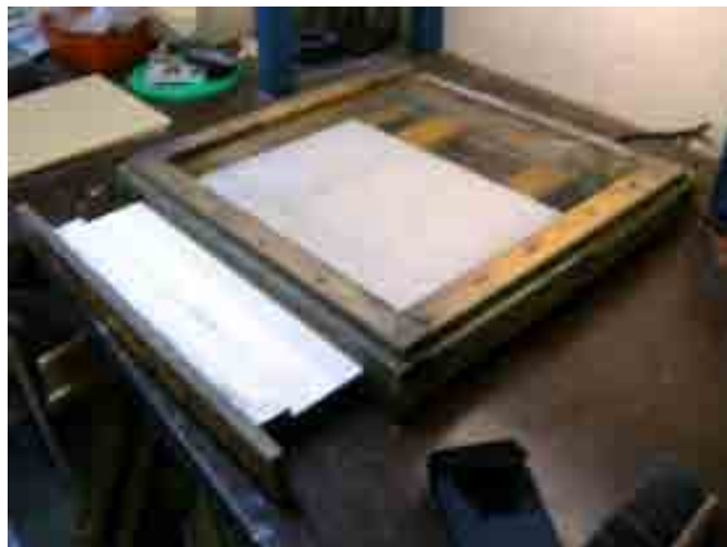
Denna typ av botten används.