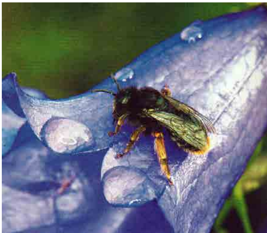
Ett blålockbi fångat på bild i författarens trädgård.

Ingemar Fries för också ett sakligt resonemang omkring företeelser som hotar de pollinerande insekterna, som sjukdomar, parasiter, och effekter av konstgödsel och bekämpningsmedel inom jordbruket. Och som en motvikt till hoten får man också tips och råd om hur man kan un-