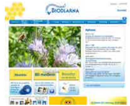
Biodlarna.se görs om.

Källa: www.forskning.se/2016/11/24/tio-satt-att-sakra-framtidens-pollinering/