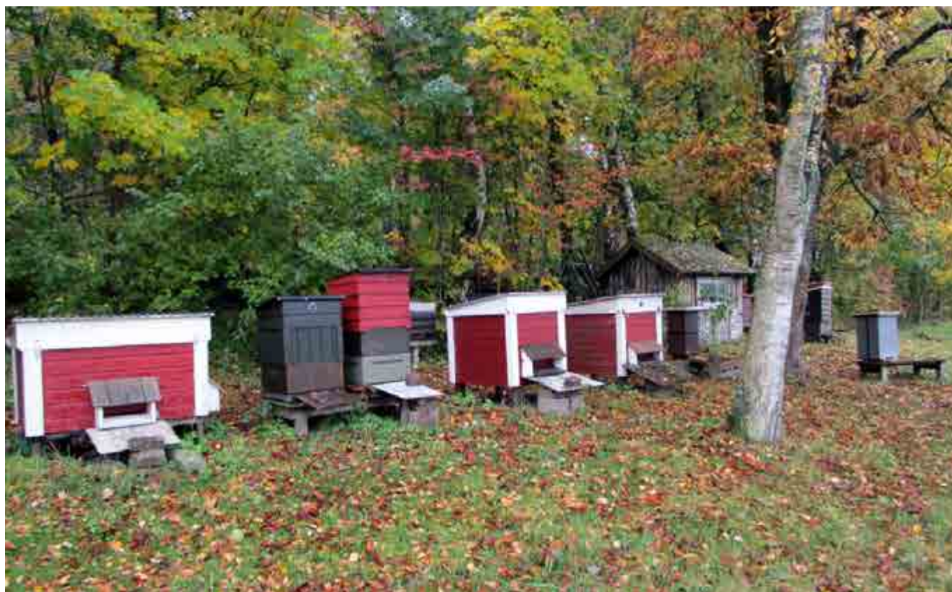
Min bigård efter invintring 2016.

säsong. Göte var medlem i dåvarande biodlarföreningen Getinge-Slöinge bivänner och med hjälp av en medlem i föreningen klarades vårarbetet av. Göte frisknade till men orkade inte själv med så mycket i biodlingen efter denna pärs. Följden blev att jag fick tillbringa mycket mer tid med bina och min relation till dem stärktes. Nu bestämde jag mig för att bli biodlare på riktigt och blev medlem i tidigare nämnda förening, vars medlemmar nu tillhör Harplinge biodlarförening.