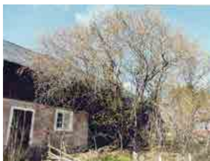
Bakom ladugården på författarens gård växer en stor sälj, som garanterar vårfrukost för bin och andra kryp.