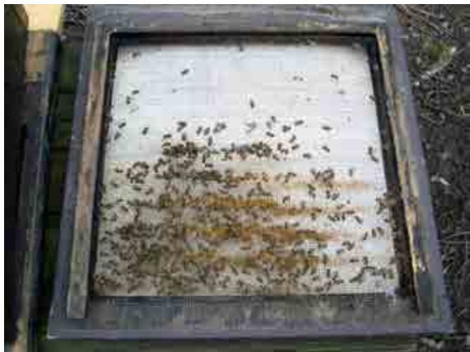
En botten efter vintern.