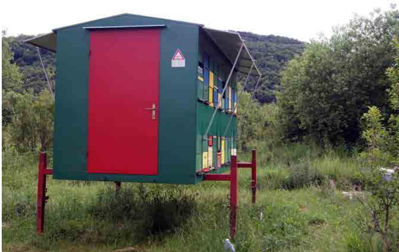
Flyttbar paviljong med cirka 40 bikupor.