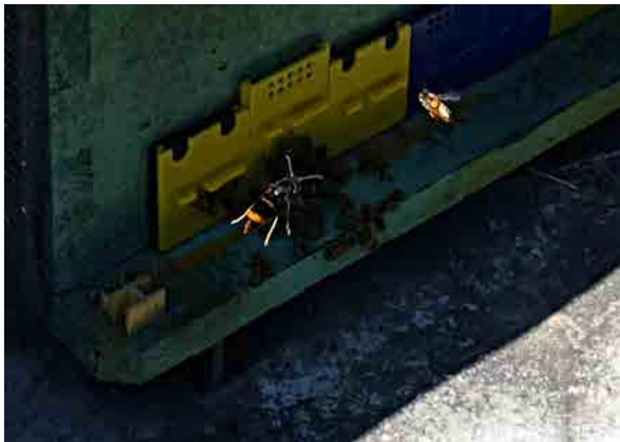
Sammetsgeting ( Vespa velutina ) som håller på att jaga honungsbin. Under hösten 2016 gjordes fynd av getingen för första gången på de brittiska öarna.