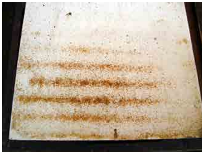
Nedfallskivan till samma botten.