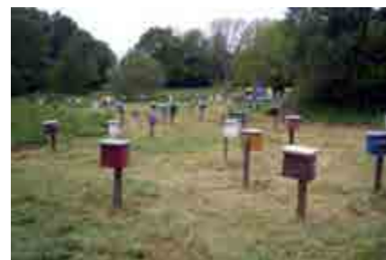
Buckfasts parningsplats på Aspö.

En annan fråga som togs upp var om honungsskörden påverkas. Samma sak här, skörden kan givetvis minska vid olika parningar men det betyder inte att hela skörden går förlorad. Egentligen är det inte heller så relevant att tala om honungsskörden under nått enstaka år. Man behöver tänka i ett långsiktigt perspektiv – välja mellan kemiska behandlingar och syror med kanske till och med utslagning av bisamhällen till följd av varrooangrepp