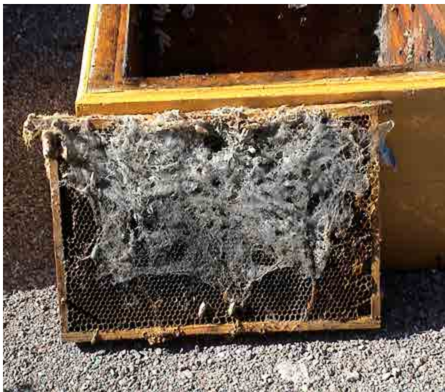
Angrepp av vaxmott ska inte bekämpas med paradiklorbensen.

Ett annat ämne, som det kommit in en del