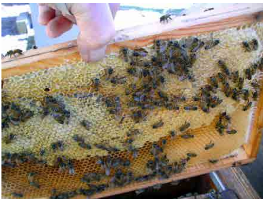
Gott om foder kvar i trågekupa.

Byta bottnar kan man däremot göra och det brukar bli i månadskiftet februari-mars. Detta är ingen nödvändig åtgärd och biodlare med många samhällen gör det inte heller. Men finns bara ett mindre antal är det ett bra sätt att tidigt få upplysning om tillståndet i kupan utan att öppna. Denna aktivitet utförs lämpligen, medan bina fortfarande sitter i klunga, en dag med någon minusgrad och vindstilla. Om lådorna lyfts försiktigt så märker bina inget utan sussar lugnt vidare. Vill man flytta en kupa några meter så är den rätta tiden nu innan bina börjar flyga med