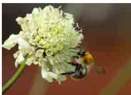
Faddrar sökes till projektet som ska ge mer mat åt bin och humlor.

Hitills har femtio lantbrukare anmält sig och står i kö för att vara med.