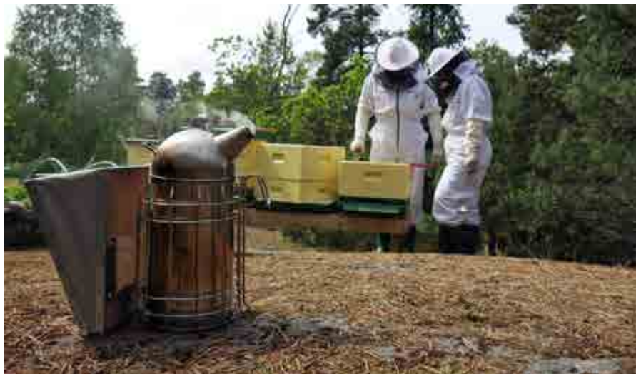
Hedersomnämmande. Vårinspektion. Juryns motivering: "Biröken i förgrunden, koncentrerade biodlare där bakom. Det är knappt att buskarna har hunnit bli så där skirt gröna runt omkring dem, ändå är arbetet i full gång. Den stilla rökpelaren ger fint liv åt en vackert komponerad bild – man känner lukten av våren!"