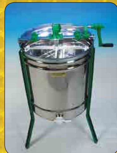
Honungsslungare, 2-, 3-, 4-, 6-, 9-, 39-ramars.

Etiketter, Vilken sort väljer Du ? Fler hittar Du i vår katalog. Tappmaskin - med eller utan bord ? Stort eller litet bord ?