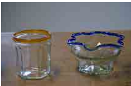
Tanken om återbruk går igen i caféets inredning. Gamla honungsburkar har gjorts om till glas och glasskålar.

”Trots allt slit så kan jag då och då hitta de där fantastiska stunderna när allt bara stämmer och jag tänker: fan, vad bra jag har det.”