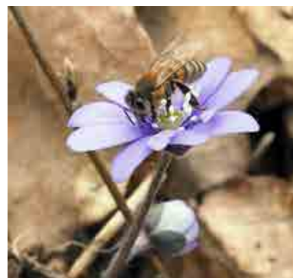
Tredjepris. Juryns motivering: "Färgerna, det blå mot det bruna... Det är så mycket vår i den här bilden! Våren inte riktigt utslagen – men hopp finns! Blommor och bin har vaknat!"