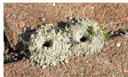
Typiska sandhögar gjorda av ett sandbi mellan tegelstenar på altangolv. Det stora hålet är in- och utgångsöppning.