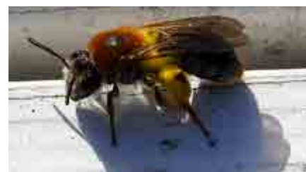
Trädgårdssandbi (hona) med pollensäcken och påtagligt färgrik behåring.