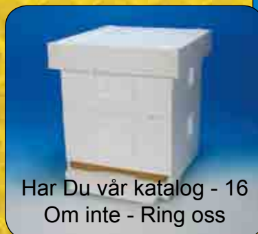
Har Du vår katalog - 16 Om inte - Ring oss