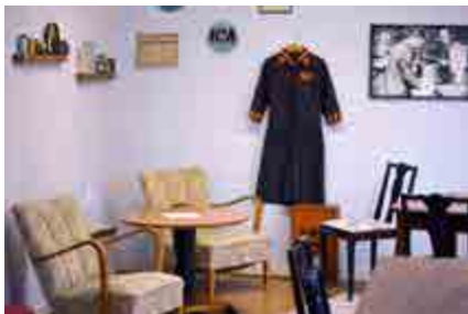
Inifrån Skogens Honungscafé. Mycket av interiören är kvarlevor från tiden som lanthandel.