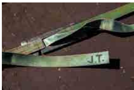
Den gröna remmen är ett minne från en norsk biodling.