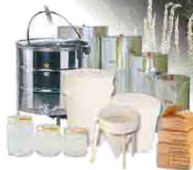
Honungshantering. Slungare, kärl, silar, glas.