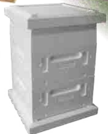
Töreboda-kupa i EPS Yttermått 462x462 mm.

Öppettider: Mån 9-18, tis-fre 9-16 Lunchstängt: 12.30-13.30 Stängt 23/6 fr kl 12.30 och stängt fredagar 8/7, 15/7, 22/7, 5/8, 12/8 och semesterstängt v 30.