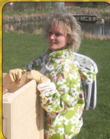
Skälderhusjackan - med avtagbar huva - olika modeller - Oliv / Vit / Design.