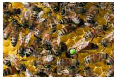
Några får alltid behålla den drottning de själva dragit upp.

än normalt i alla fall, för det finns alltid något man grubblar över. Svärmar. Puckel. Drottningar. Hur mycket honung det ska bli. Eller hur lite. Vädret. Björnar, som på våra breddgrader är ett ständigt närvarande orosmoment, även om man har stängslat efter konstens alla regler.