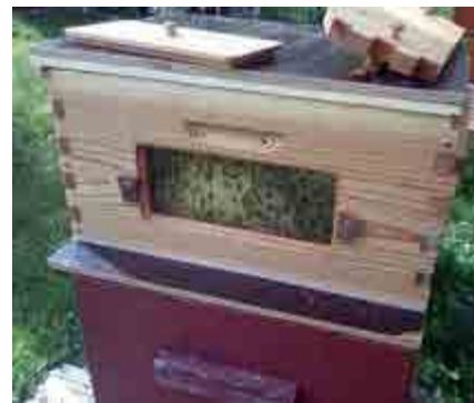
Bild 1a och 1b: ”Hybridkupa” med en isolerad FH-skattlåda på en isolerad kupa med norsksformat med en utskuren adapterskiva emellan.

Fortsätter det fina draget är det bara en fråga om ett par veckor innan jag ger mig på ett skattningsförsök, även om resultatet blir ännu inte helt mogen honung i mindre mängder. För detta ändamål har jag redan ställt i ordning skattningsanordningen – en för fullständig skattning och en för delbeskattning (bild 3a, b).