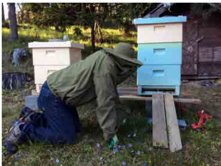
Andrapris. Juryns motivering: "Vad händer på flustret? Kul bild, där kan man ligga länge. Undrar hur det står till i kupan efter vinterns vedermödor? En bild som visar på biodlarens nära relation till sina husdjur."