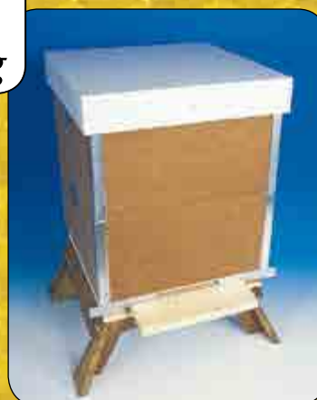
Skälderhuskupan, Ln, Hls, Ls & Svea

Apistan och Apiguard är nu registrerade som veterinärmedicin. Vi får ej sälja direkt till biodlare utan försäljningen måste ske via apotek. Dessbättre behöver du inte gå till veterinär och få recept, utan det går att beställa / köpa direkt på ett apotek. Dock kan det löna sig att fråga på olika apotek då marknaden är fri för konkurrens och de olika apoteken sätter sina priser själv.