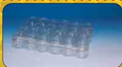
Glasburkar i maskinpackade plastpaket 350, 500 samt 700gr. Pall- samt bulkpriser.

Månadens vara Juli / Aug Honungssil 137N 100:-Sek