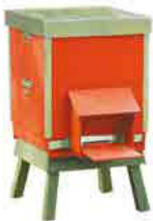
Kupor och tillbehör. Trä- och plastkupor.