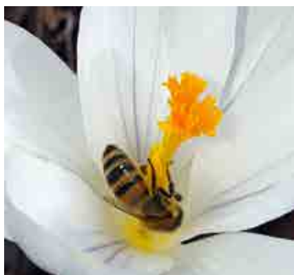
Hedersomnämmande. Juryns motivering: "Blomman signalerar någon slags elegans och det gör också biet som försöker greppa det livgivande innersta. En härlig bild."

detaljer! Härliga färger. Så finurligt fotografen har