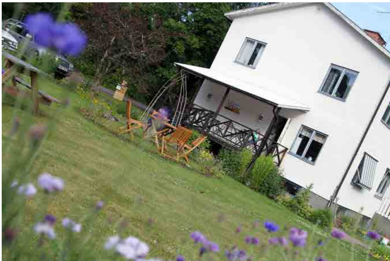
Lanthandeln i byn Flohult har blivit café där företaget Skogens honung har sin bas.