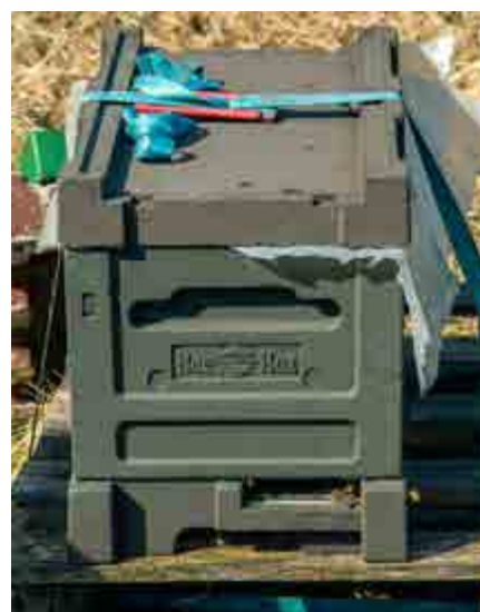
Att arbeta med avläggare är en trivsamt syssla.