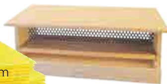
Pollenfälla att placera framför flustret.