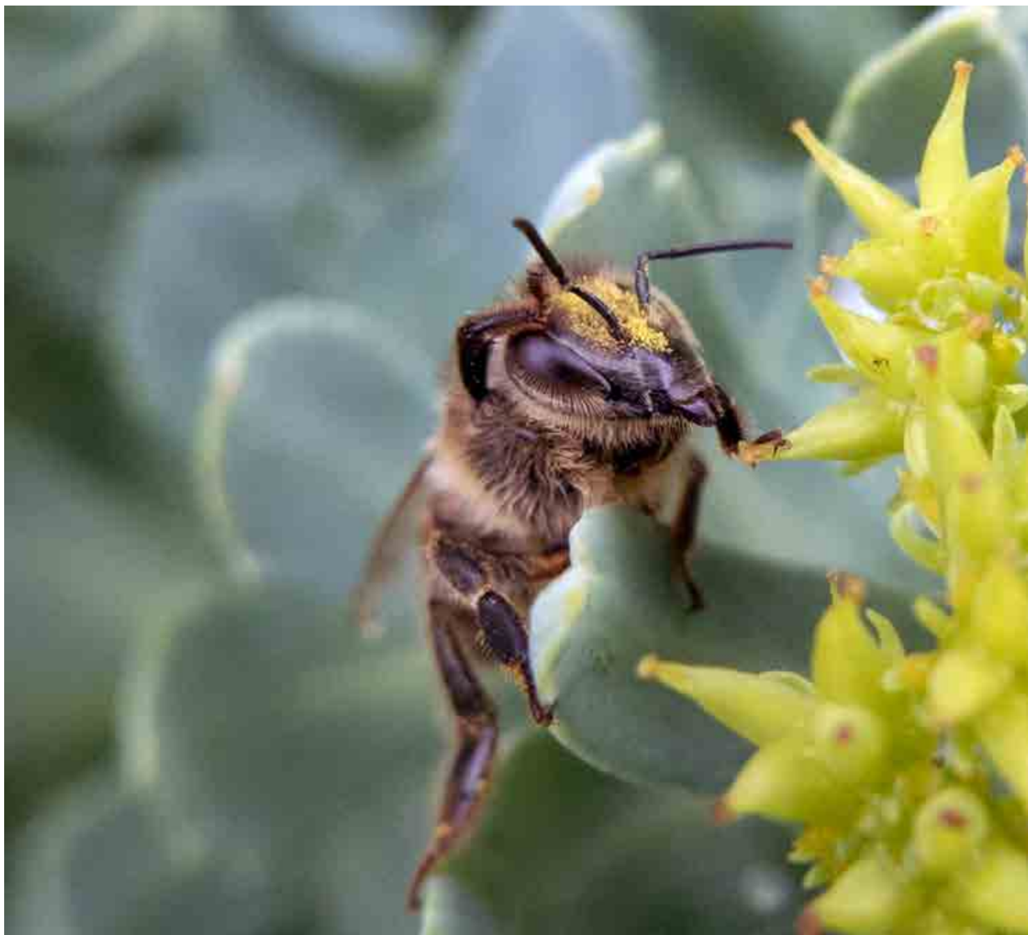
Förstapris. Juryns motivering: "Ett alldeles förtjusande foto på ett bi som nästan tycks torka sig ren i ansiktet. Vilka lyckats fånga hennes vardagsbestyr i vårens brådska!"