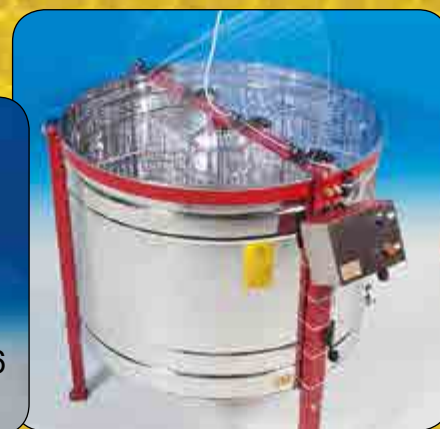
Självvändig slungare, finns i olika storlekar.

Joel Svenssons Vaxfabrik, Skälderhus, 266 94 Munka-Ljungby