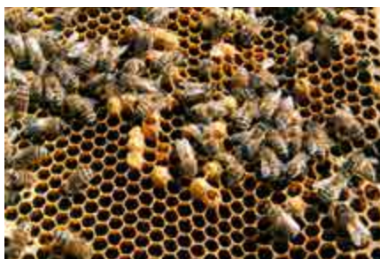
Något samhälle hade bara puckel, och fick skatta åt förgängelsen.