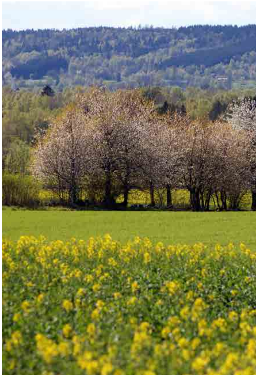
De vackra bygderna med vilda körsbärsträd och raps nära Stenstorp i Västergötland. Här trivs bina!

– Det är väldigt roligt att vi kunde sy ihop detta till en helhet. I stället för att