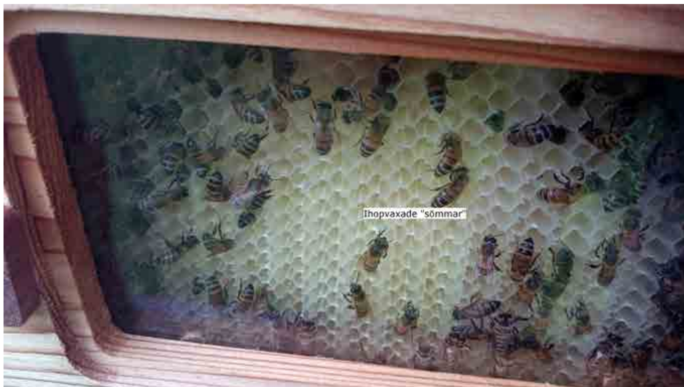
Bild 2: Bin i färd med att täta FH-cellernas skarvar med vax och deponera honung.

por i diverse trädgårdar runtom i Sverige när ägarna insett omfattningen av vägen fram till skattningsbar honung, som ju i ordets dubbla, och fulla, betydelse verkligen bara är biodlingens biprodukt, medan det stora nöjet och behållningen ligger i att låta sig förundras över krypens vidunderliga livsanpassning och mångsidighet. Yrkesbiodlaren må kanske uppfatta detta något annorlunda, som vid all stordrift, men det bör nog stå helt klart för alla oss hobbyodlare.