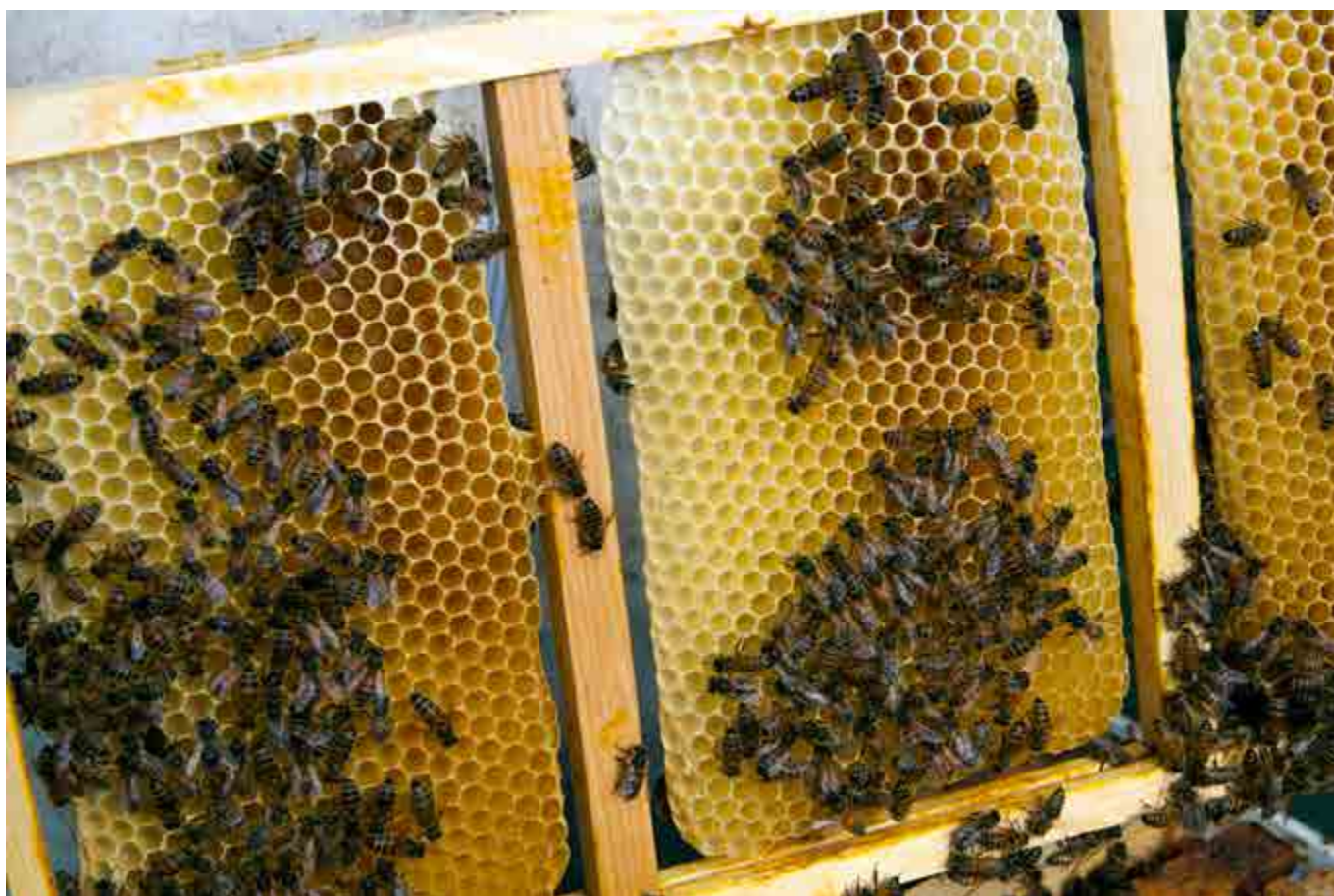
Skära drönarvax är nödvändigt, odla dem är också nödvändigt.

► handgrepp som under åren har visat sig vara bra att kunna.