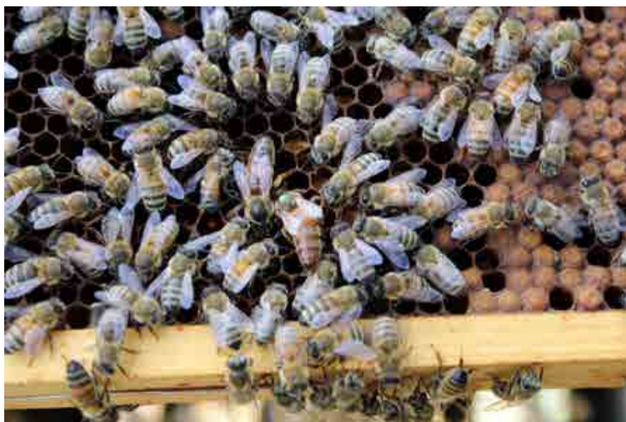
Hedersomnämmande. Juryns motivering: "Vilken ögonblicksbild! Den gamla drottningen bredvid den nya. Ett stilla byte."

detaljer! Härliga färger. Så finurligt fotografen har