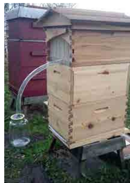
Bild 3a och 3b: Tappningsanordning till alla ramar samtidigt respektive endast en ram (utan stöd).

rar jag vart den traditionella och erkända biodlarspecifika experimentlustan och utvecklingsglädjen tagit vägen. Även (framförallt!) skeptikerna välkomnas på våra forum för att rikta uppmärksamheten på oklarheter, erfarenhetsbrister och hanteringsbekymmer vad gäller FH; vi behöver diskussionen – inte bara glada bilder på nyinköpta, väloljade paradjakupor och välvilliga förhoppningar om arbetsbefriade godsaksskördar. Delta i utvecklingen av