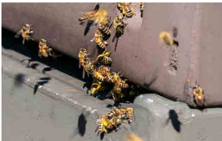
Kall vår i Hälsingland, men fart på flustren ändå.