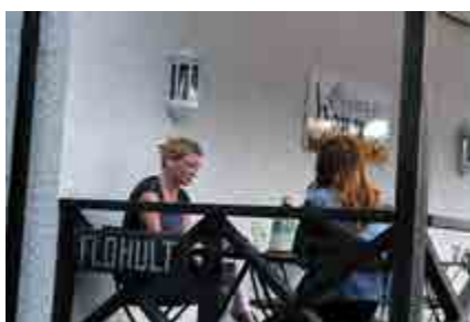
Utifrån Skogens Honungscafé. Foto: Emma Jansson