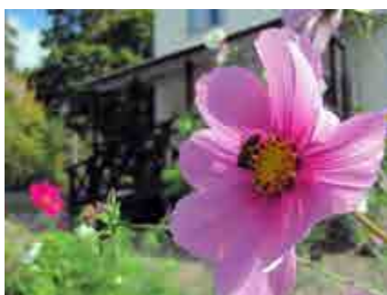
Bild från pollinatörsträdgården med lanthandeln i bakgrunden.