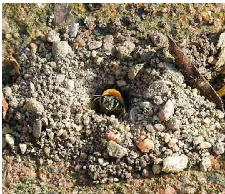
Här är bionan (Kan man kalla henne drottning?) på väg upp ur hålet för att fortsätta samla pollen och nektar.

Hur familjen reagerar på att ha bin på altanen går jag inte in på här, men alla är överens om att de inte är aggressiva och säkert riktigt trevliga att ha om man gillar bin.