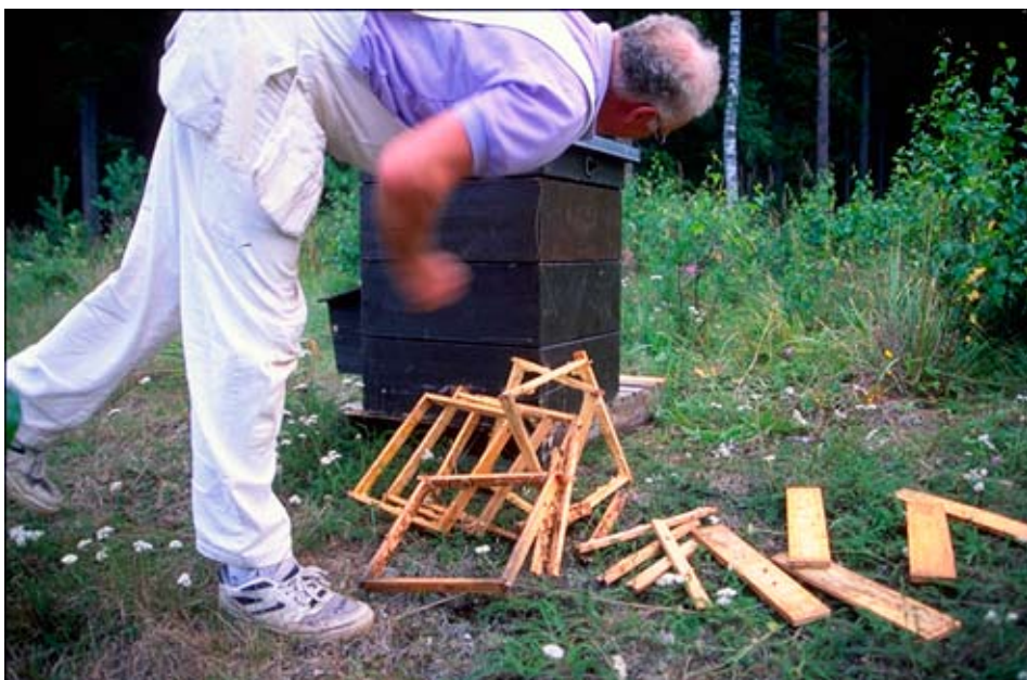
Om man kommer till sin bigård och upptäcker skada, ska man genast kontakta länsstyrelsen.