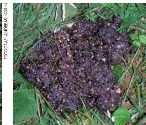
Björns spillningar varierar i form, färg och konsistens beroende på vad björnen har ätit.