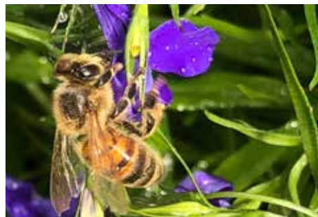
Bi på Lobelia.

När slutskattningen är gjord , blir det en hel del mörka ramar. Ramar som flyttats upp. Ramar som fått stilla svärmlust osv. En och annan ram plockades undan redan i juni, vid första slungningen. Dessa förvarar jag i frysen