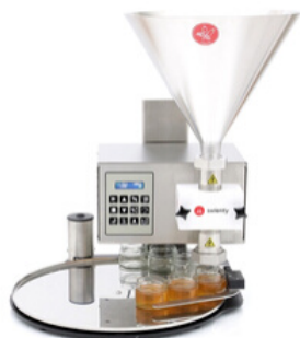
Tappstation 45 cm bordmodell Inkl. Dana Api Matic 1000

Se mer information på www.lpsbiodling.se