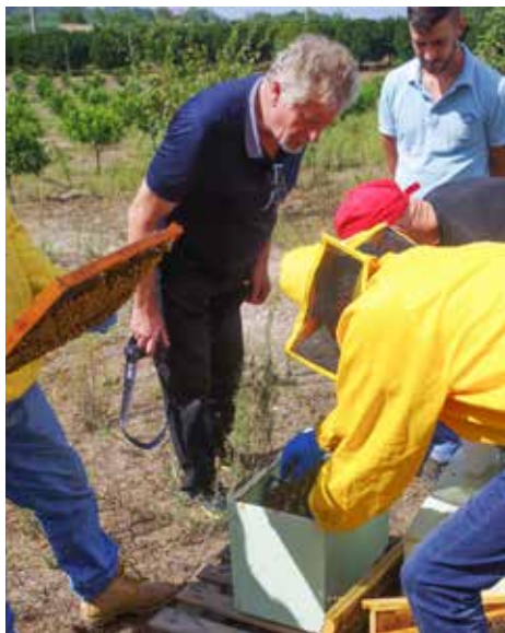
Inspektion av kupa efter Lilla kupskalbaggen ( Aethina tumida ) från studieresan i Italien 2017.

honungsbi har inte ett tillräckligt effektivt försvar.