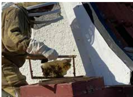
Här tar jag hand om en svärm i en takfot.

Mitt projekt med nordiska bin har inte gett något resultat, jo ett medlemskap i föreningen NordBi. Så tyvärr blev det inget av detta i år. Jag valde istället att