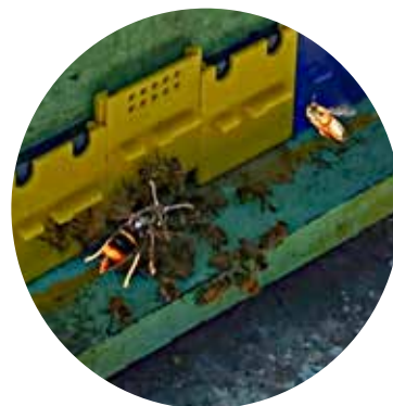
Sammetsgeting ( Vespa velutina ) i färd med att röva honungsbin utanför flustret.

Sammetsgetingen ( Vespa velutina ) , som påminner mycket om vår bålgeting, är ingen exotisk skadegörare utan räknas som en invasiv främmande art. Den regleras inte i lagstiftningen som rör biodlingen. Sammetsgetingen kan orsaka stora skador på biodlingen och har spritt sig relativt snabbt i Europa. Den är etablerad i Frankrike, Belgien, Nederländerna, Spanien, Italien och Portugal och har hittats i Storbritannien och så långt norrut i Tyskland som Hamburg. Den kan sannolikt överleva i södra Sverige. Sammetsgetingen är specialiserad på honungsbin men äter även andra insekter, bär och tunnskalig frukt. Den fångar levande bin i luften utanför kupan eller går in i samhället för att röva. Vårt europeiska