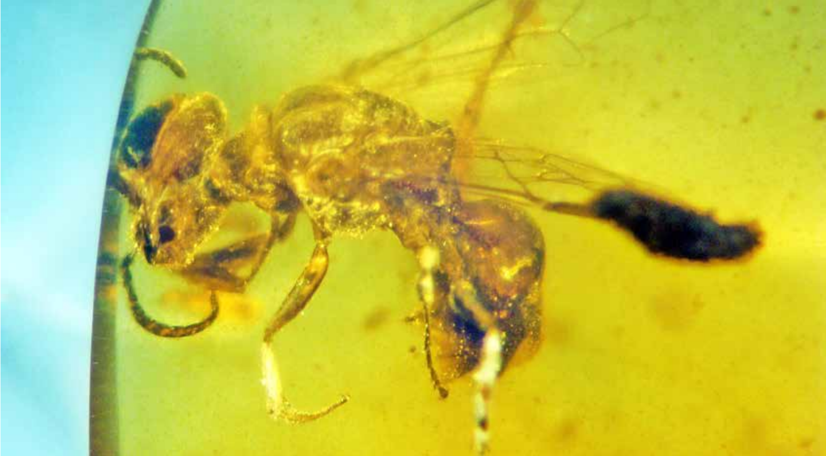
Discoscapa apicula är det äldsta fossila fyndet av ett pollenbärande bi.