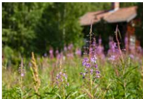
En av våra bättre biväxter-Mjölkört eller Rallarros.

Men just nu kan man njuta av långa ljusa sommarkvällar. Lite semester men tidiga mornar i bigården, innan dagstemperaturen blir för hög. Håll med,