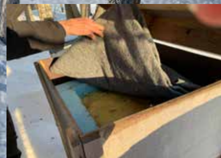
Lagom med isolering för att släppa in luft.