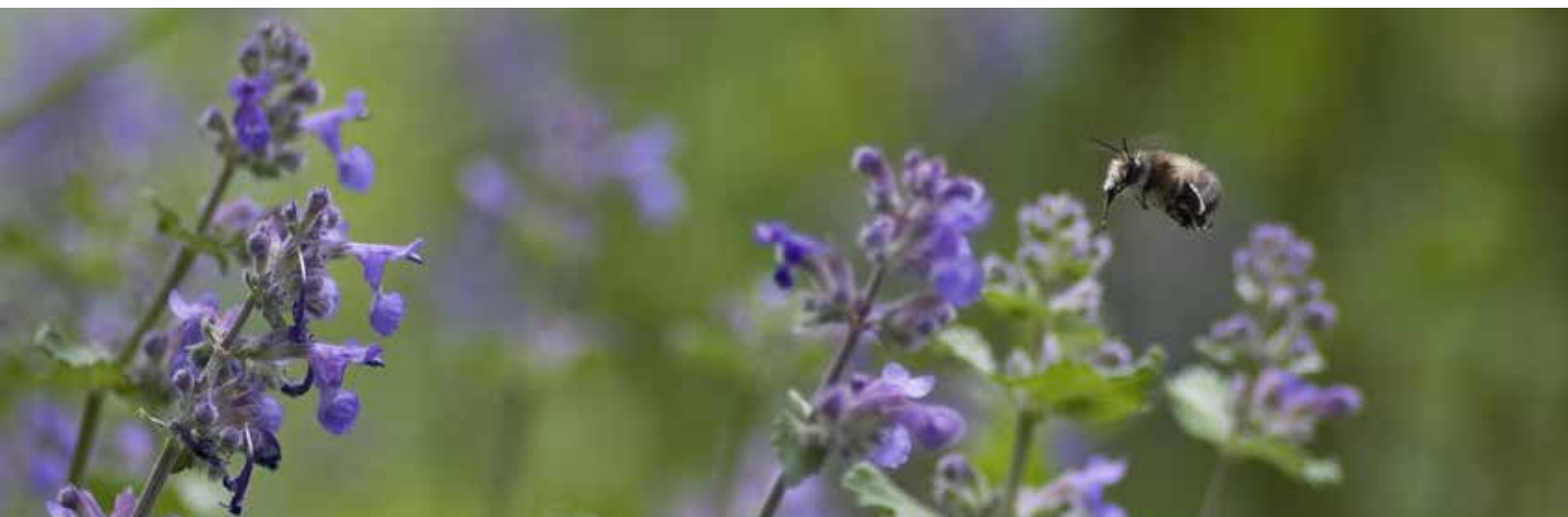
Kattmynta - Nepeta. En av många fantastiska växter för bin.