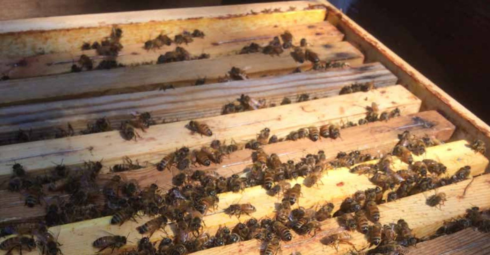
Flitiga vårbin är en bra början på en lyckad säsong.

En glänta, en kulle eller rent av en skog i ryggen. Det är tacksamt med morgonsol och kanske lite vandrande skugga under den varmaste delen av dagen, för att åter framåt eftermiddagen och kvällen ge lite värmande sol. Finns det en naturlig bäck eller vattenhåla så är läget optimalt. Titta även vilka träd och buskar som finns omkring. Kan du se vad som finns runtomkring kan man också räkna ut vilken typ av flora som finns.