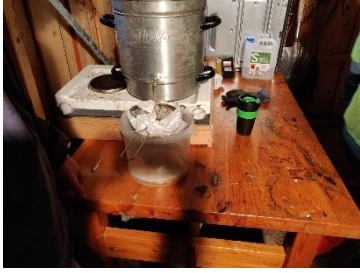
Bild 1 Fulvax blir finvax