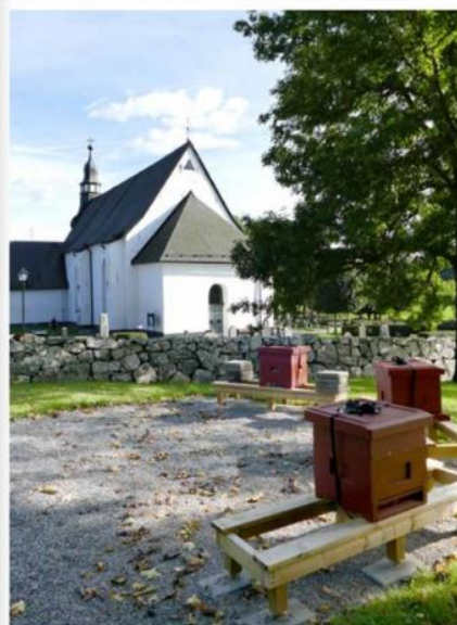
NU STÅR DE TRE kupaerna på platsen där det var tänkt från början. Ytterligare en kupa ska sättas upp snart. Information om bina och miljöarbetet.