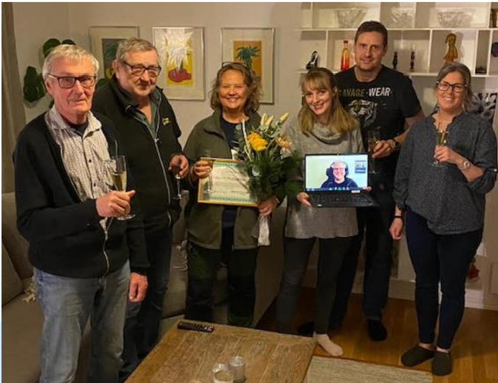
Bilden tagen vid vårt konstituerande möte där vi samtidigt firar att vi mottagit Miljöpriset 2021.