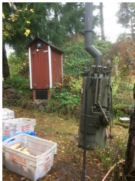
"Ångpannan kopplad till smältskåpet"