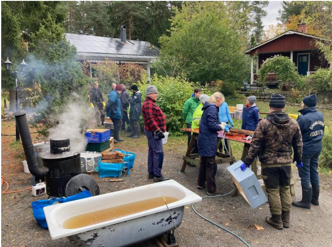
Årets traditionsenliga Vaxsmältardag 21 oktober på Lillbacka