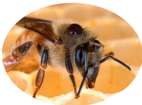
Bi med Varroa