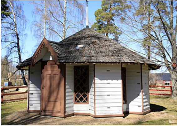
Bipaviljongen finns vid Valla Gård.